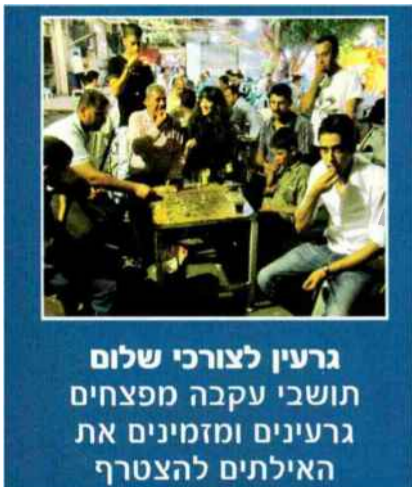
גרעין לצורכי שלום תושבי עקבה מפצחים גרעינים ומזמינים את האילתים להצטרף